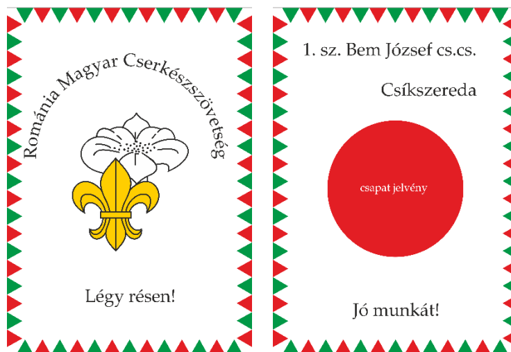
6. ÁBRA - CSAPAT LOBOGÓ