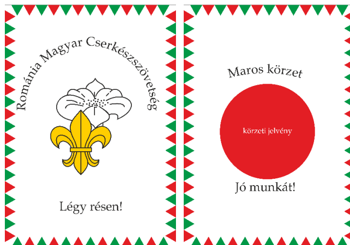
4. ÁBRA – KÖRZETI LOBOGÓ

7.§. A szövetségi, körzeti fanionok grafikája megegyezik a lobogó grafikájával és annak méretarányosan csökkentett változatával.