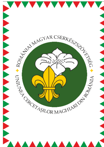
3. ÁBRA – SZÖVETSÉGI LOBOGÓ