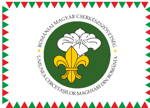
2. ÁBRA – SZÖVETSÉGI ZÁSzlÓ